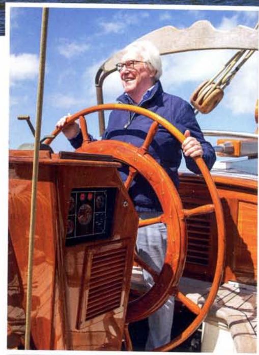
boven: Met 8 knopen langs de Friese kust!