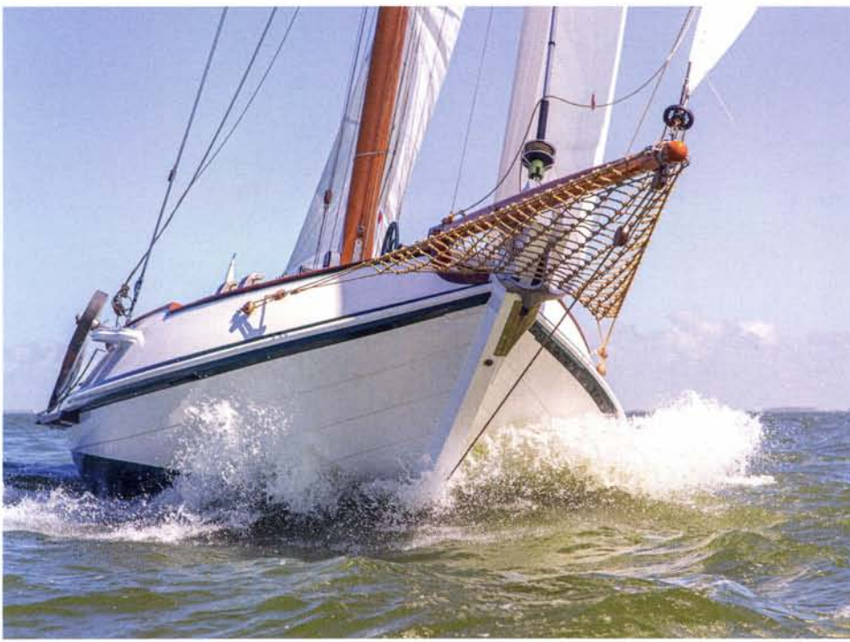
boven: Met speels gemak stampst de 46 tons schokker aan de wind door de golven