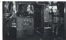
Een kijkje vanuit het voorschip in het dagverblijf. Achter het dwarsscheeps geplaatste schot is de kombuis.