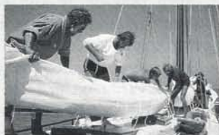
Aan het einde van een fijne dag worden de zeilen zorgvuldig opgeborgen.