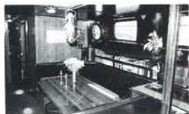
Een kijkje vanuit de kombuis in het gezellige dagverblijf.