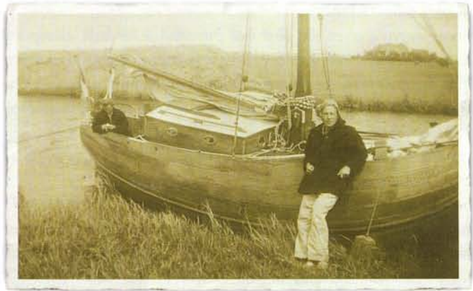
1947, de Jol afgemeerd in Friesland.