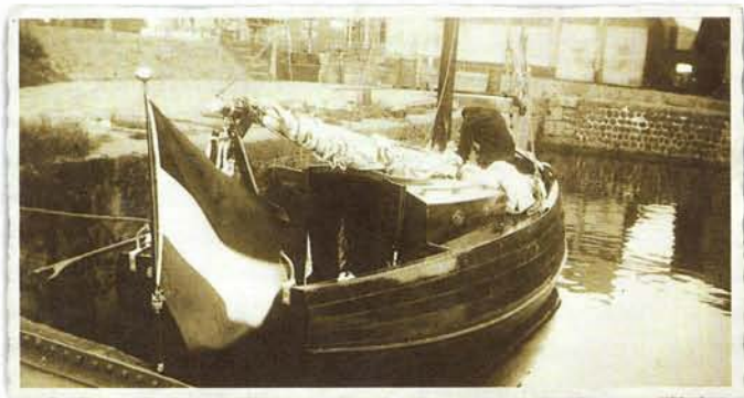
De stadssluis in Lemmer, 1947.