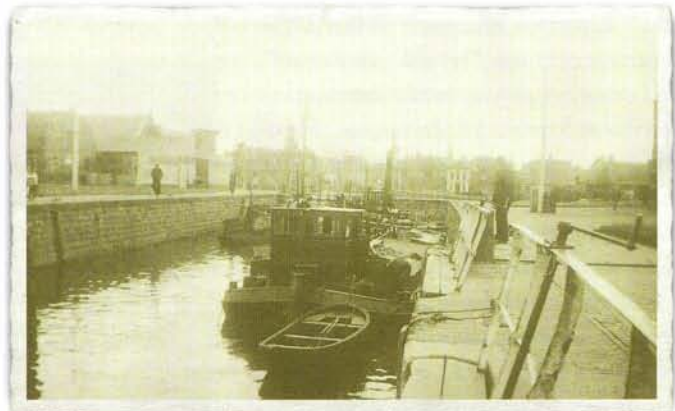
1947. De sluis bij Terhorne zag er toen heel anders uit.