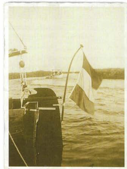
Links aan afdruk van het werfplaatje. De foto's zijn gemaakt in 1946 terwijl de Meerkoet in Aalsmeer ligt afgemeerd