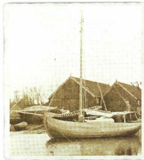
Rechts: Stavorensche Jol, gebouwd door J. Wildschut & Zn., Gaastmeer. Bron De Waterkampioen, 1933.

28 m 2 in zeil en stagfok. Zoomede een kluiver van 7.75 m 2 . De beplanking is van eikenhout, 22 m.M. dik, het voordekje van oregonpine, de kajuit van teak, met een stahoogte van 1.40 m. Zulke scheepjes worden zwaar gebouwd; de spanten zijn eiken krommers van 7 c.m. in 't vierkant!"