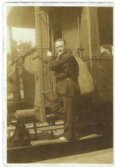
De trein naar Aalsmeer reed nog in 1947.