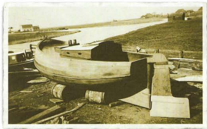
Een opname uit 1946, vermoedelijk staat het jacht hier bij De Vlijt in Aalsmeer.