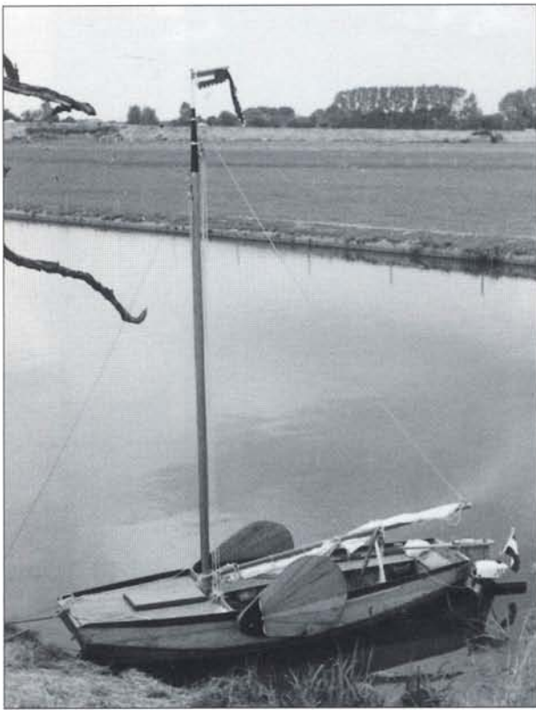
Boven: De Bornster in Linge, 1989. Bornster 1990. (rechts).