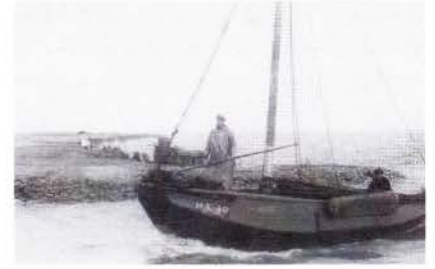
De HL 10, ex HN 1, komt het haventje van Laaxum binnen.

'Vader heeft de kotter toen verkocht en opdracht gegeven aan Jaap Heijman in Enkhuizen om een nieuwe schouw te bouwen. Deze werd volledig getuigd, inclusief kluiver en bezaan. Tjib Lub zette er een tweecilinder Lister motor in van 16 PK. Ook deze schouw kreeg het nummer HN 1. In 1948 ging hij ermee vissen en