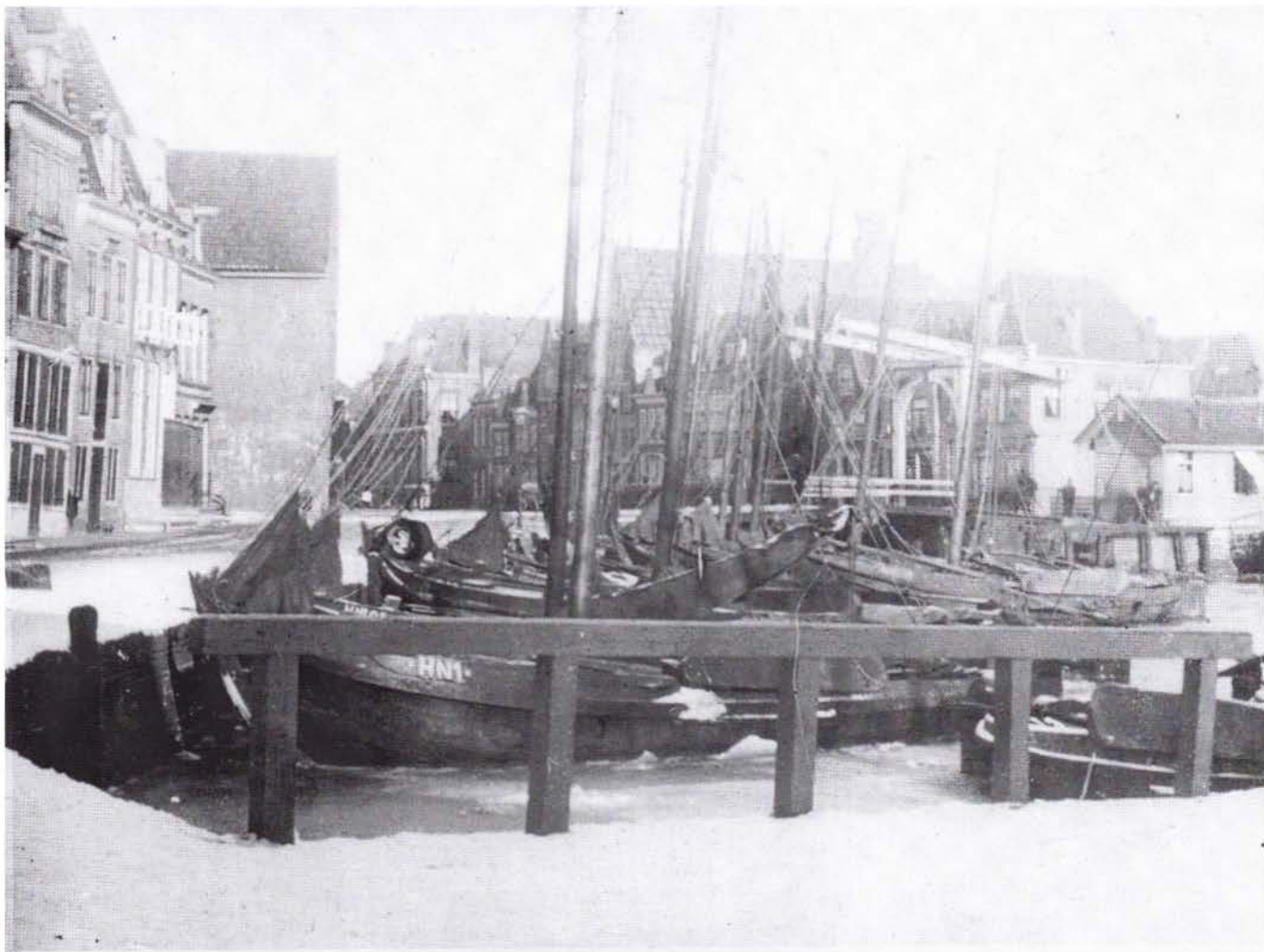
Oude foto van de Hoornse Veermanskade met vooraan de botter HN 1.

De Visscherij Courant van 19 november 1910 schreef over deze gebeurtenis het volgende: 'Hoorn, 14 november 1910. Tijdens het stormweer van Donderdag en Vrijdag is de Hoornsche boot (de Vereeniging) los geslagen van de steiger waarvan het gevolg was dat de botters HN 25 en 56 bekneld geraakten tusschen het Hoofd en de boot zoodat ze beide buiten de vaart moeten. Van HN 25 is het roer stuk en over het geheel gekraakt, het schip maakt veel water. Ook de botter UK 50 welke hier in de haven lag heeft aan het bovenboord een flinke stoot van de boot gehad, welke ook repareren moet.'