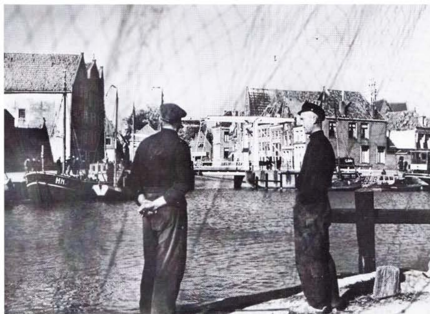
Kortstondig droeg een kotter, links in beeld, het nummer HN 1.

Jan Blokker eindigt zijn verhaal met de volgende, vooral meer persoonlijke herinneringen aan de naoorlogse periode. 'Na mijn schoolopleiding ging ik begin