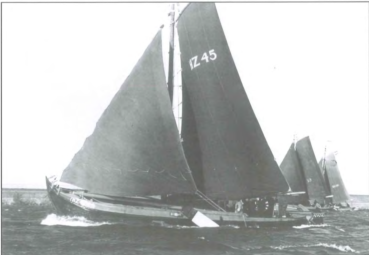
Tijdens wedstrijd op het Gooimeer, 1993 (periode P. Weisenbach)

Het is vooral door de grote toewijding van de Weisenbachs dat de schuit nu in nagenoeg originele staat is. Voor een goed begrip: al het hout is in de loop der jaren vervangen, op één ligger na. Deze spant vlak achter de mastbank is zo goed als verrot en is uit curiositeit