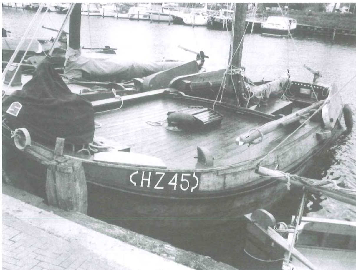
In de haven van Huizen, 2005