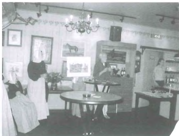
Bijeenkomst ter gelegenheid van de overdracht in 'De Huizer Haven', 2005