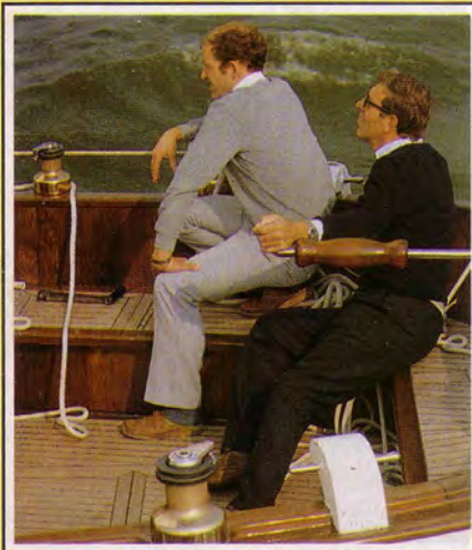
De ruime kuip is met teak afgewerkt. De roestvast stalen liertjes aan de kajuitopbouw zijn voor de zwaarden.