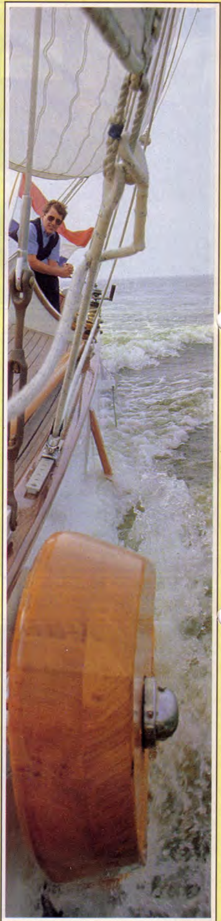
Zeilen op een aak betekent hard werken.