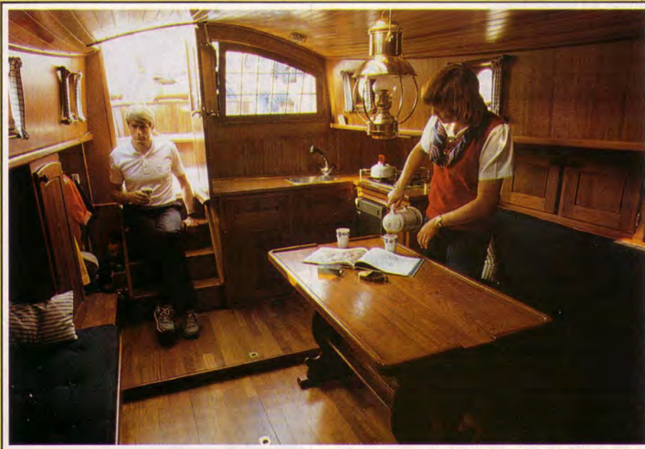
Dit schip is helemaal afgetimmerd in teak.