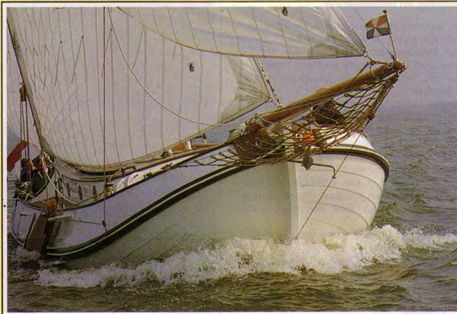
Aan de wind gaat schip mooi door het water. De gangen stroken prachtig.

teakdelen gaan weer van dek af; gaten boren in dek en boorsel verwijderen; teakdelen schoonmaken; teakdelen met beddingcompound aanbrengen; delen vastschroeven met roestvast stalen schroeven; naden met tweecomponentenrubber dichtspuiten en schuren. Dit is de enig juiste manier om een teakdek op een stalen schip te leggen. Zoals op de foto's zichtbaar is, zijn alle randen van dek en kuip voorzien van teak en dat geeft het schip een rijk aanzien.