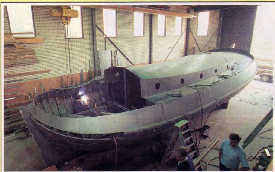
Het staalwerk van deze aak is bijna klaar.