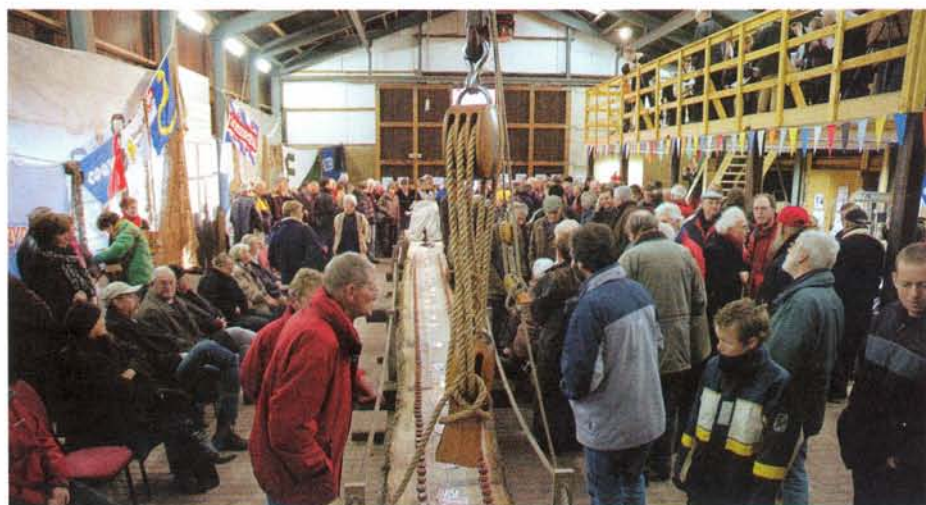
De kielbalk is opgesteld, met de benodigde glaasjes Beerenburg, aangeboden door sponsor Sonnema.