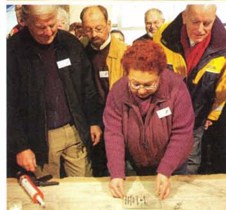
De munt wordt door vrijwilligers op de plaats van de mast op de kielbalk aangebracht en het afdeklaattie met tekst (links) komt er overheen.

Lalkens een polsdikke, bijna 1 meter lange levende mannetjespaling "om de palingstand in het Heegermeer te bevorderen". De drie Friese houtbouwprojecten werken samen in het gemeenschappelijke platform "De Driewerf". 1