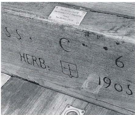
Boeier "Maria Pauline"; brandmerken in het achterschot.