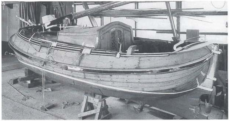
"Maria Pauline" (ex "Griet" enz.) van J.W. Hoorn, overzicht. Herk.: J.W. Hoorn