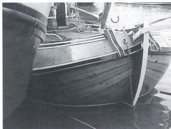
“Maria Pauline”, vooraanzicht.