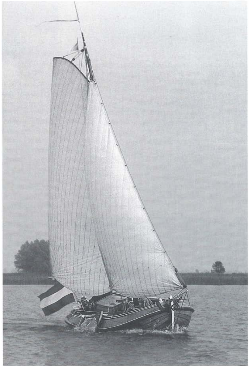
"Maria Pauline", onder zeil.