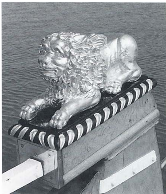
“Maria Pauline”, roerleeuw.