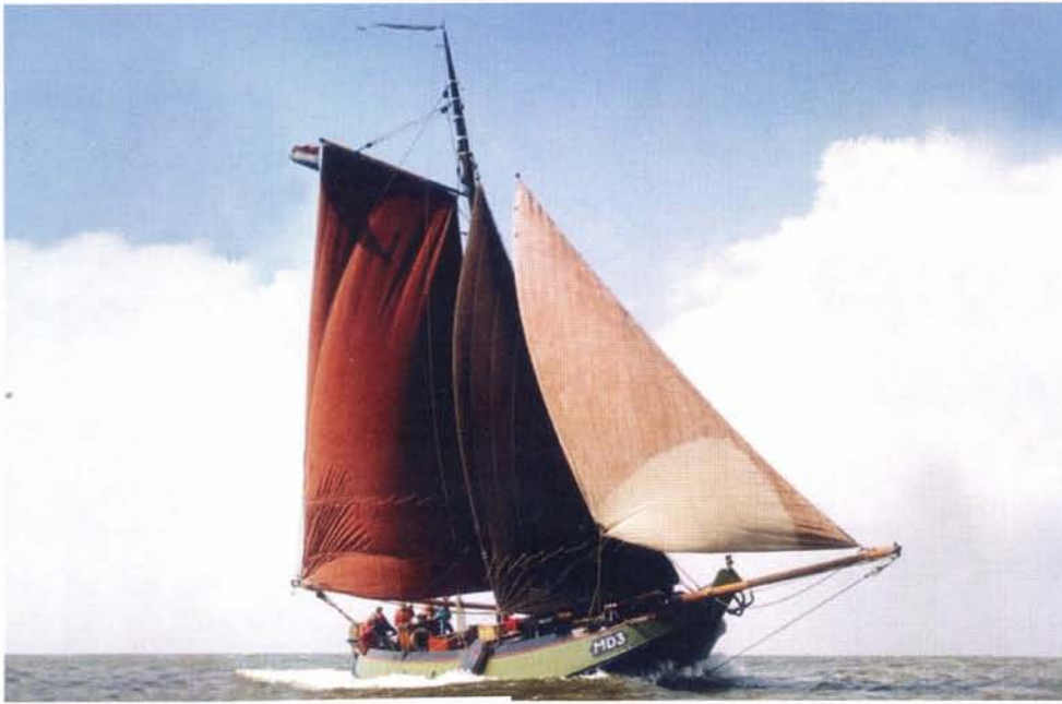
boven: De bekende, haast iconische foto van de stoere torpedistenschokker MD3