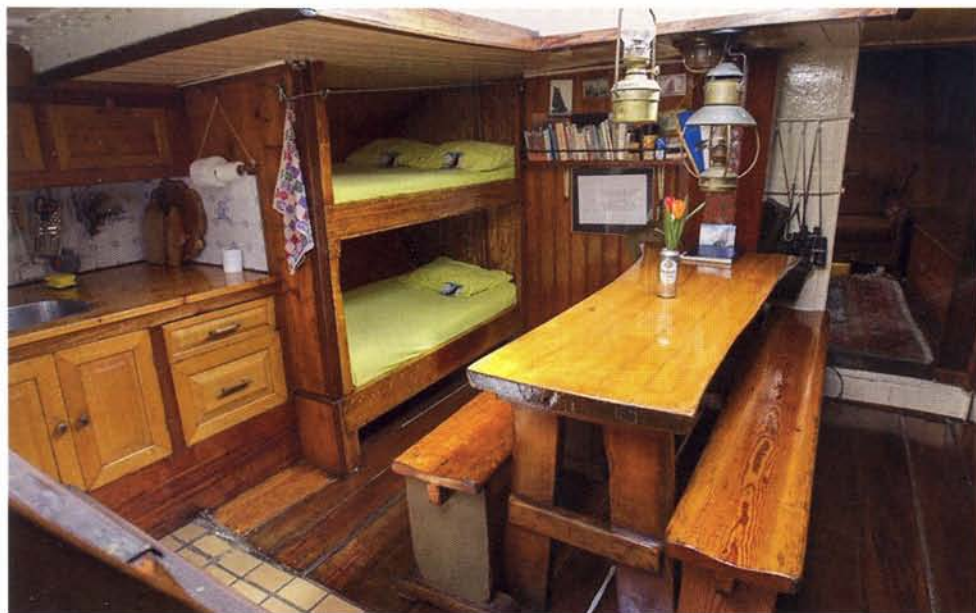
links: Het robuuste interieur van de MD3 waarover Henk ruzie maakte, want hij wilde het niet kwijt