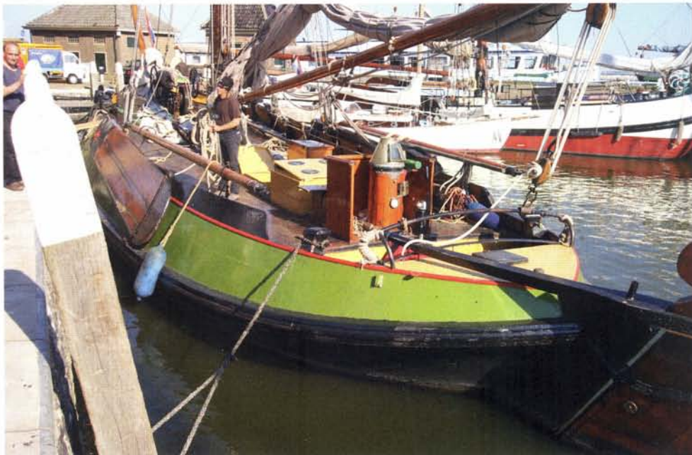
boven: De schokker afgemeerd. Henk Hortensius voer altijd met niet meer dan 12 personen

Al die tijd hadden we de radio uit gehouden,