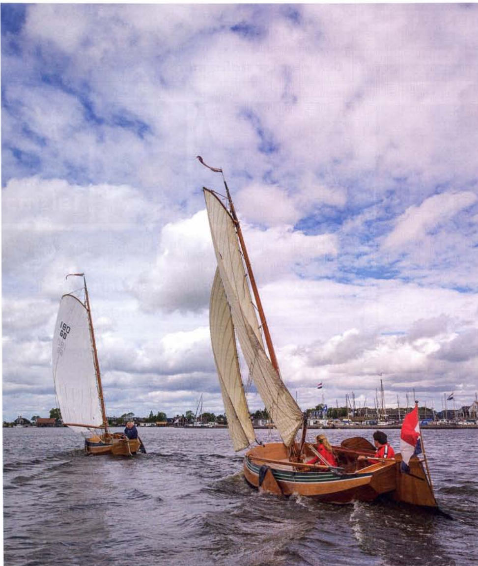
links: De verschillen in zeeg, boeisel en zetboord tussen de twee schouwen zijn hier goed te zien