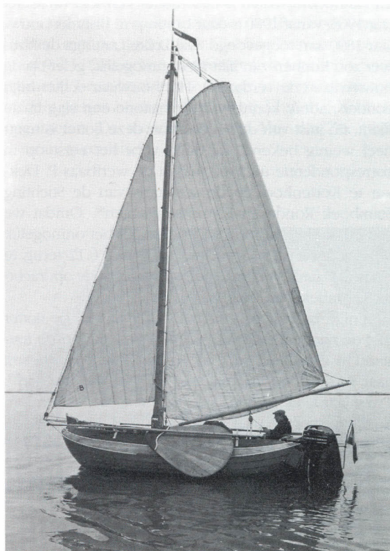
Onder zeil.