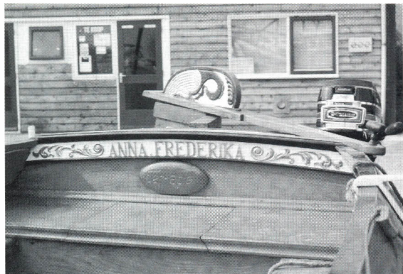
“Anna Frederika” Hennebalk en roerkop.