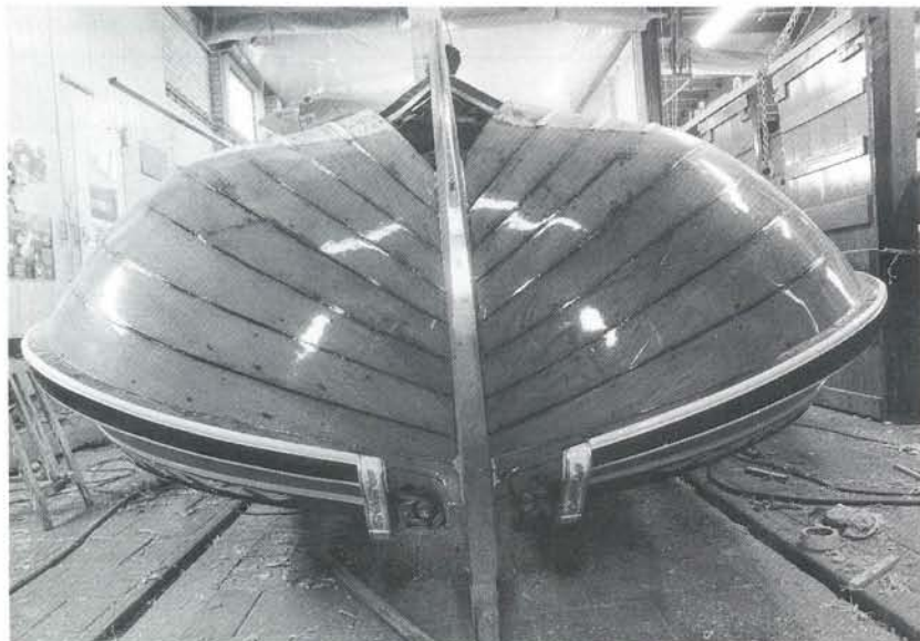
De 'Neptunus' tijdens de grote winterklus bij De Jong Joure. De gepiekte spantvorm is nu goed te zien.

Onder water werden alle gangen uitgefraisd en werden er eiken latten ingelijmd. Daarna werden alle gangen, op elk spant met twee roestvrijstalen schroeven, opnieuw vastgezet. De oude ijzeren spijkers werden of verwijderd, of, als ze te ver waren weggeroest, afgezaagd en weggedreveld. Alleen al in het vlak kwamen zo'n 600 rvs-schroeven en boven water nog eens 200 stuks. De Jong vertelde dat bij het vastdraaien van de schroeven de huid weer krakend tegen de spanten getrokken kon