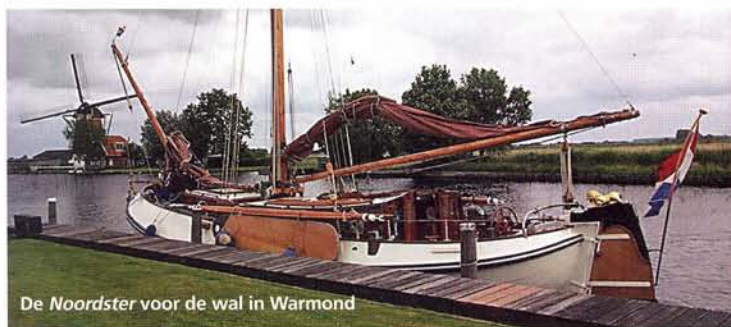
De Noordster voor de wal in Warmond