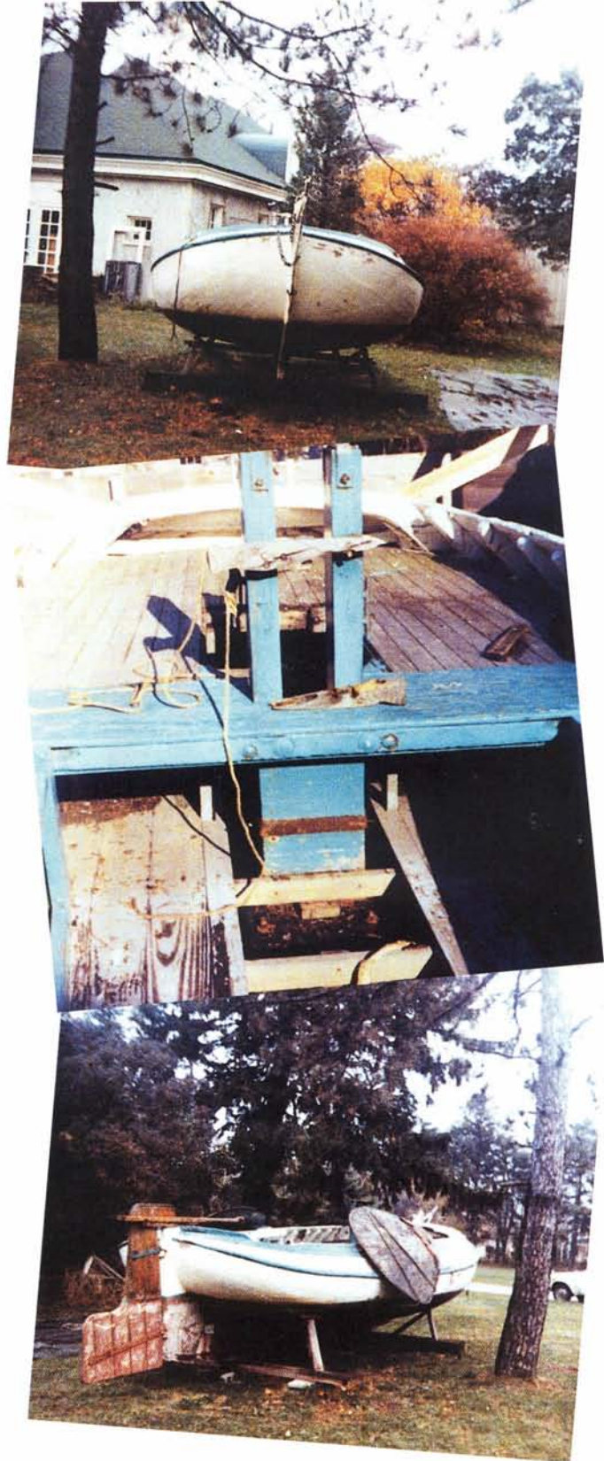
Tekst: Jan van Wijlen

En hiermee eindigt dan het leven van een roemrucht schip. Eigenlijk al in een tijd waar hier dit soort schepen niet meer gesloopt werden, maar ja, Ouderhoek was op de verkeerde plaats.