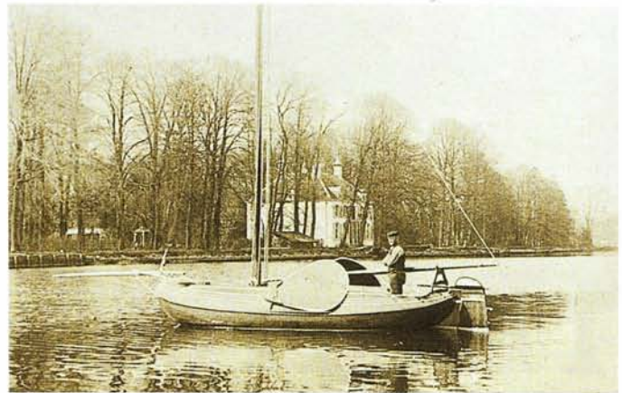
De 'Ouderhoek' kort na de bouw.

ze tweede. In alle wedstrijdverslagen is slechts één wedstrijd te vinden, waarbij ze ver achteraan in het veld eindigde. Dat was in 1913 bij Hollandia op het Braasemermeer. Ouderhoek was een geduchte tegenstandster die schepen welke jarenlang favoriet waren naar de kroon stak. In het wedstrijdverslag van de Zaanlandse Zeilvereniging staat: "(...)Marie Anna, vroeger geabonneerd op den eersten prijs, (had) een geduchte tegenstander in de nieuwe Ouderhoek , die met een flinken voorsprong den prijs verdiende." (De Watersport) "In datzelfde jaar kwam ze op de Kaag ook even voor haar rivalen over de finish." (De Watersport) De wedstrijd op de Kaag in 1918: "In de drie wedstrijden voor de