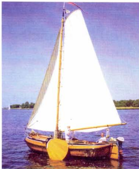
Peep weer als Fries jacht nadat de kajuit weg was gehaald en de naam Kale Jonker kreeg.