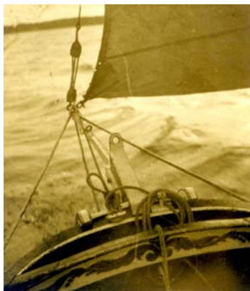
fotograaf en datum onbekend Poseidon aan een steiger bij het Paterswoldsemeer. De fok die gevoerd wordt is horizontaal gesneden. Dit wijkt af van het gebruikelijke verticale.