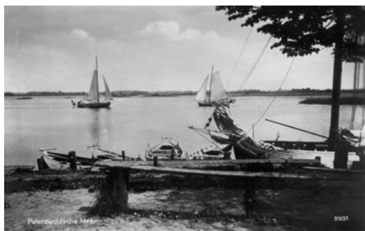
Twee ansichten in een iets gewijzigde compositie. Zeilend rechts de Poseidon met een sterk achterover staande mast. Foto Kramer 1915