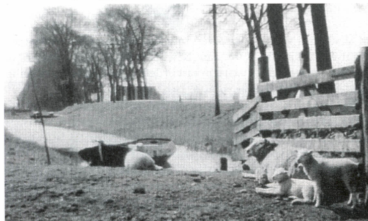
Onder: De Rûzer, juni 1954.