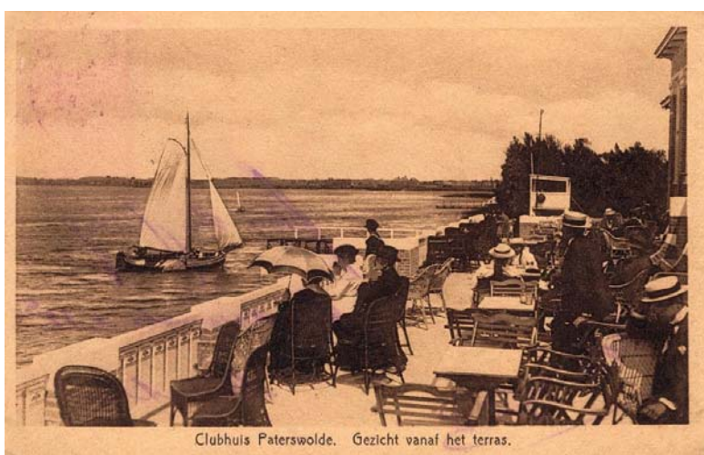
1918 met uitsnede uit oorspronkelijke foto Duidelijk is te zien hoe de mensen zich verhouden tot de grootte van de boot.