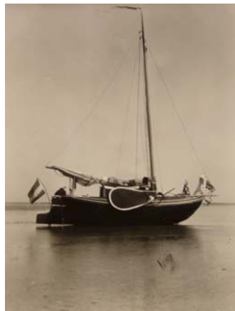
Meeuw. Foto links boven coll. Bergsma genomen in noord-Duitsland onderweg naar de Weser (1935). Foto links onder coll. Mulder. Foto rechts coll. Mulder Drooggevalen juni 1935. Deze reis werd gemaakt samen met de boot van de familie Bergsma. Aan bakboordzijde achter werd een buitenboord motor op een steun gevoerd.

Hoewel niet van iedere foto onomstotelijk vaststaat dat ze op het Paterswoldsemeer zijn genomen, bestaan er de nodige met vooral veel “volk” aan boord. Zowel zeilend als stil liggend. Onderstaand een foto waarvan de randen weggesneden zijn, maar die een goed overzicht geeft van de zeilende Stânfries.