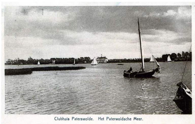
Foto Kramer 1918 uitsnede van oorspronkelijke foto coll. Levert . "Stânfries" . Ansicht werd tot circa 1950 verkocht. Bij de determinatie van R.C.E.G. Martens en Jaap Helder staan voor dit schip drie namen genoemd: Wildsang, Meeuw en Stânfries. De naam Wildsang ben ik verder nergens tegengekomen.