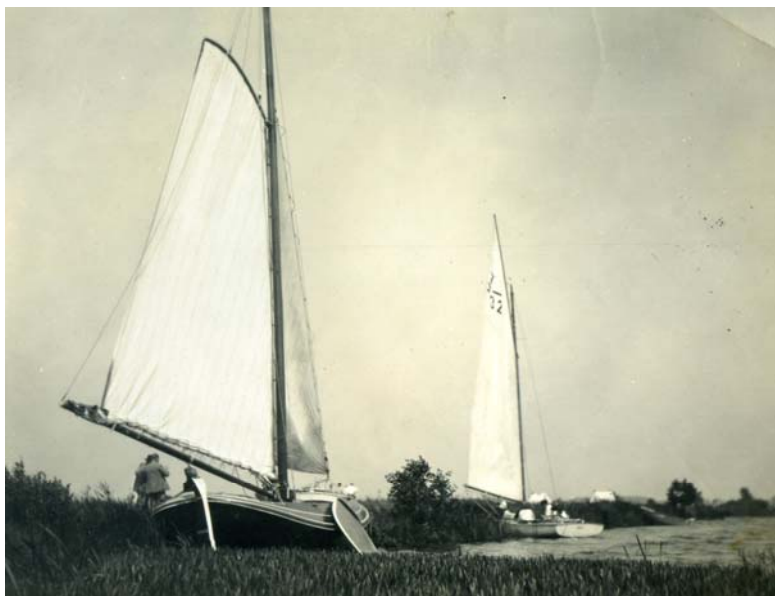
Stânfries foto genomen voor 1927.

Bij het cursief gedrukte vond ik andere informatie als de heren Huitema en Vermeer geven.