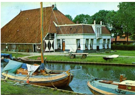
Ansicht uit circa 1975 voor de werf van Pier Piersma in Heeg. Het scheepje rechts is de Stânfries nog met verhoogd teakhouten dek en een teakhouten kajuit. Inmiddels vaart ze al weer jaren rond als volwaardig Fries jacht, met een laag voordek en zonder kajuit. Zie het opvallend hekje op het voorschip. scan GTC.

Slechts twee, door Lantinga uit IJlst, gebouwde Friese jachten hebben vanaf de bouw een hoog liggend dicht voordek zoals ook bij een boeier voorkomt (de Jansje Maria uit 1941 en de Bestevaer uit 1953). Deze twee schepen hebben zodoende geen bedelbalk.