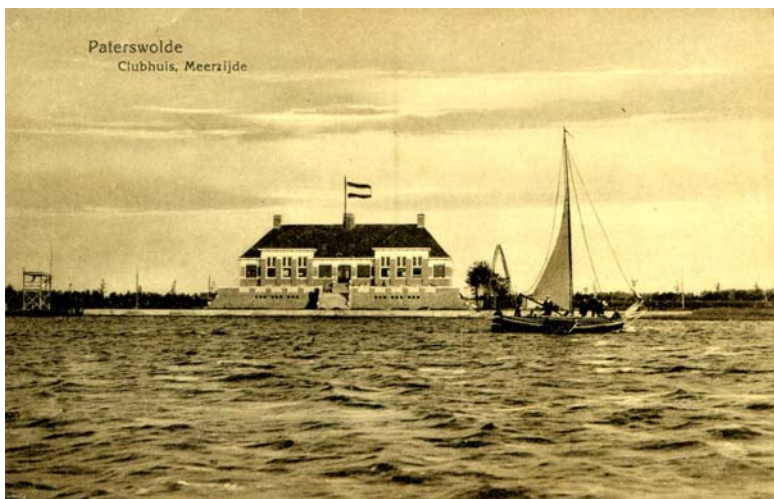
1917 foto Kramer voor het clubhuis van DTP