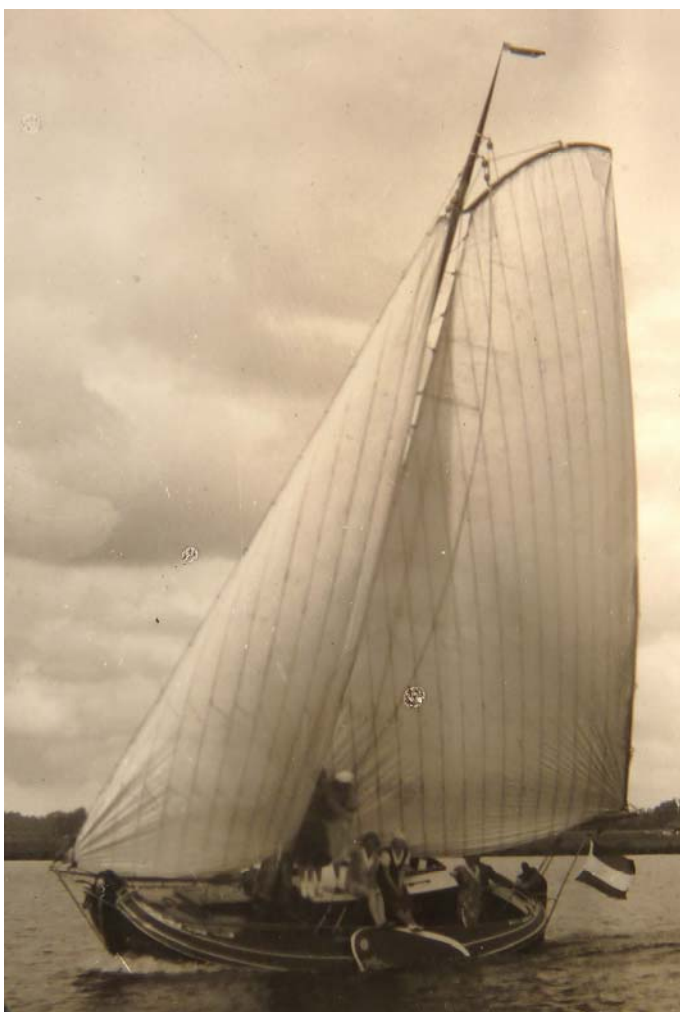
Meeuw Coll. Mulder foto 1932 Met dames aan boord. Uitsnede van een iets grotere foto.

Hoewel niet van iedere foto onomstotelijk vaststaat dat ze op het Paterswoldsemeer zijn genomen, bestaan er de nodige met vooral veel “volk” aan boord. Zowel zeilend als stil liggend. Onderstaand een foto waarvan de randen weggesneden zijn, maar die een goed overzicht geeft van de zeilende Stânfries.