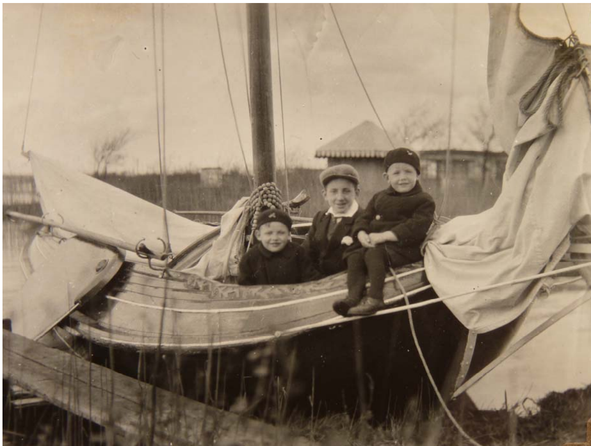
Stânfries. Collectie Mulder gedateerd 1927. Foto J.G.Mulder. Oud secretaris en oud voorzitter van DTP, J.G.Mulder fotografeerde veelal personen. Ook zijn er de nodige foto's van plezier- en beroepsvaartuigen. Aan de hand van zijn bewaard gebleven albums kunnen de nodige dateringen gegeven worden. Welke kinderen op deze foto afgebeeld staan is onbekend. J.G. Mulder was zoon van "kapitein Mulder".

Latere foto's uit deze albums laten de Stânfries met kajuit zien. Op het Paterswoldsemeer maar ook in Duisland en op het wad. Een schroefraam of buitenboordmotor zijn niet zichtbaar. Dat wadden tochten niet werden geschuwd, is met het zeevarende verleden van opa Mulder niet vreemd. Misschien is het wel dank zij hem zo geweest dat er bij DTP al heel vroeg al tochten naar het Duitse Waddeneiland Borkum werden georganiseerd.