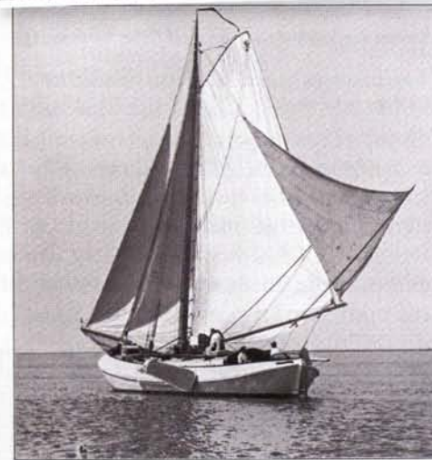
„Onrust” van den heer W. H. de Vos te Dordrecht.