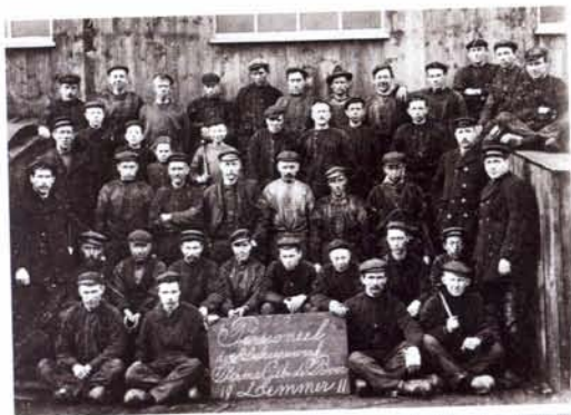
boven: Werknemers van de werf Gebr. De Boer, 1911