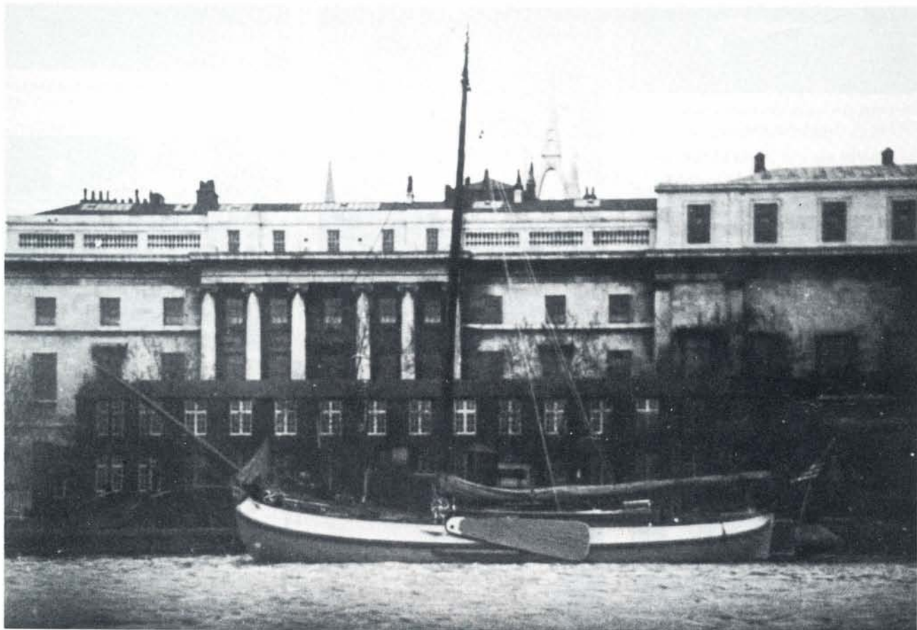
De Lemsteraak „Trekvogel” op de Thames voor Billingsgate, de „ligplaats” van de palingaken uit Heeg en Gaastmeer.

31 vermeld. De zeilen werden gemaakt door M. F. de Vries te Lemmer. Deze Lemsteraak werd op 22 juni 1913 als „Helena” te watergelaten.