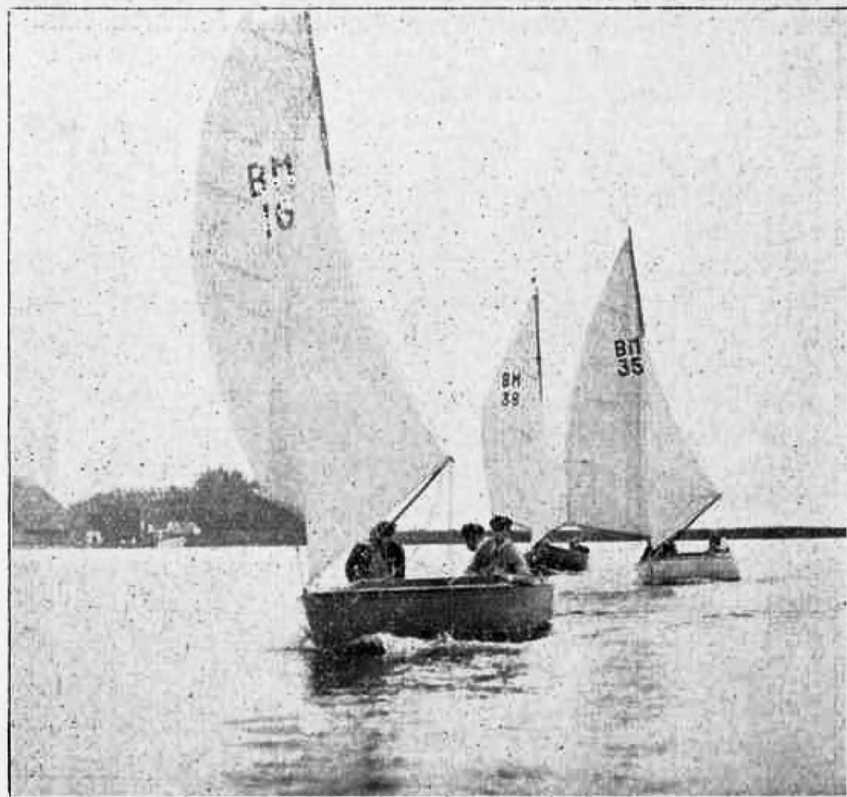
B. M.ers in de wedstrijd Drachten-Veenhoop 1931.

De eigenaar van „de May” was zoo bereidwillig hem toe te staan dit jacht, zoo vaak hij wilde, te bezichtigen