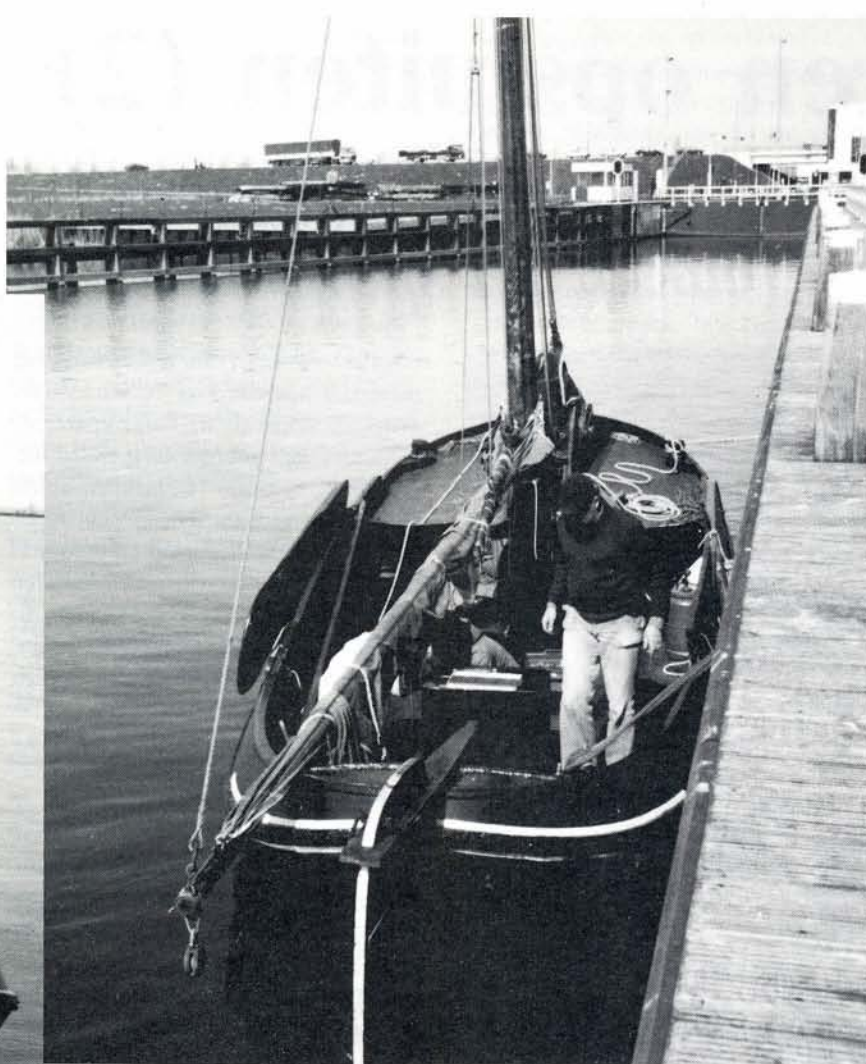
◀ Bij de sluizen van Enkhuizen ▲