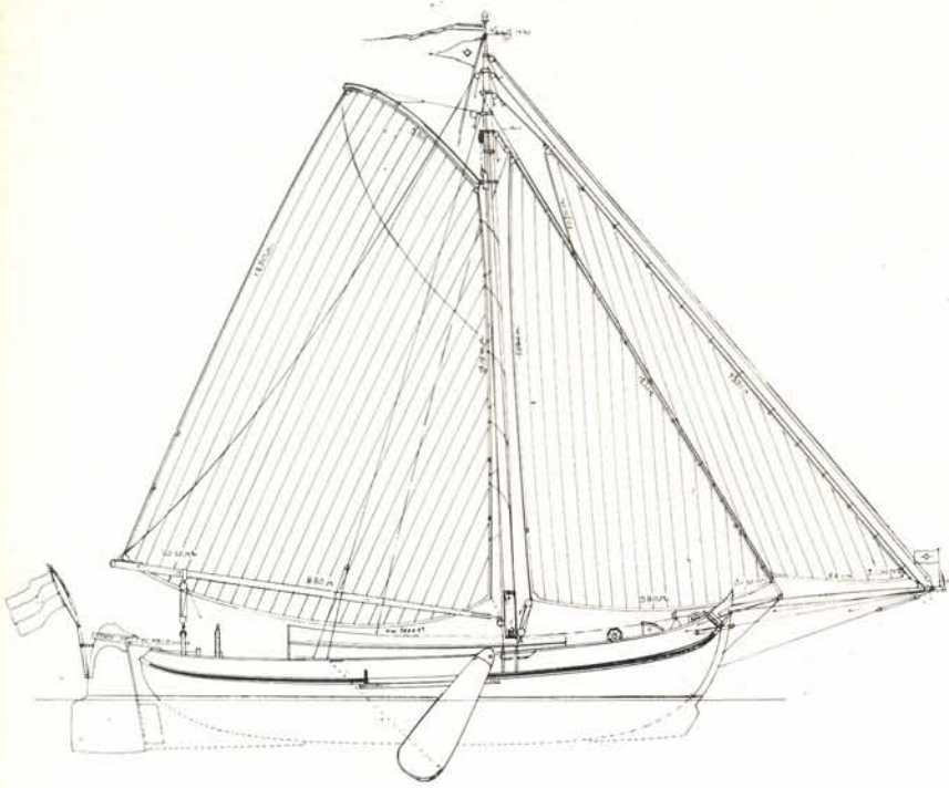
Stalen aakjacht Antoinette Elizabeth, ontwerp H. Kersken Sr. Zelttekening schaal 1 : 200. Zelloppervlak 129 m 2 , grootzeil 70,50 m 2 , fok 31,50 m 2 , kluiver 27 m 2 , botterfok 50 m 2 .

landse watersportvloot bijzonder verrijkt en de glorie van onze oude schepen tot nieuw leven gebracht. Eigenlijk zou het wel passend zijn om te salueren voor de eigenaar van een fraai rond of platbodemschip als wij op een van onze tochten zo'n pronkstuk van een schip tegenkomen. Zo zou men dan zijn waardering kunnen tonen.