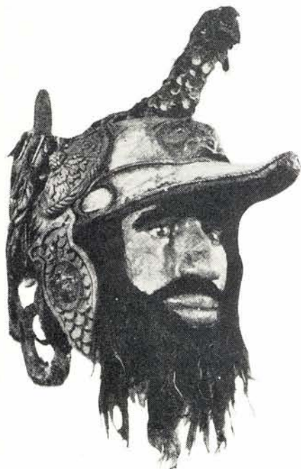
De kop van Antigon in het Museum van Folklore te Antwerpen en.....

.....op het roer van de naar hem genoemde tjalk.