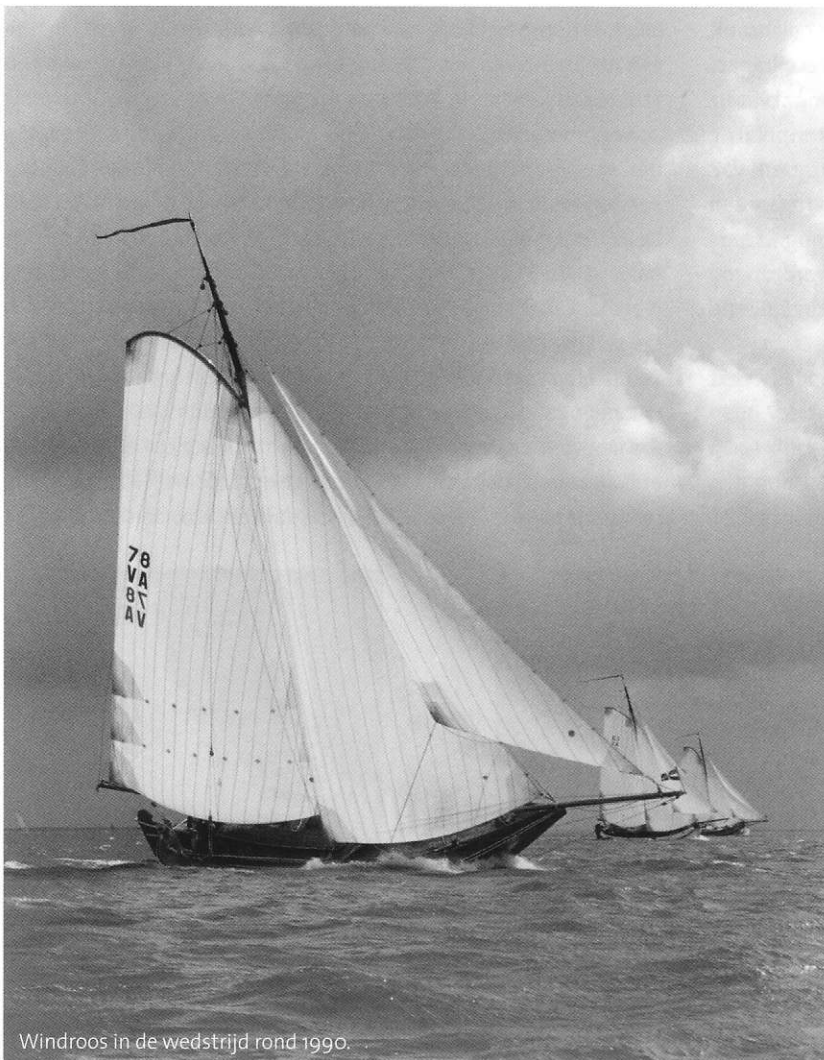
Windroos in de wedstrijd rond 1990.

”Het eerlijke antwoord is dat ze me binnenin te nat werd. Ga maar na. Je ligt een paar weken in de haven met het zonnetje op één en hetzelfde boord.. Boven de waterlijn krimpen alle naden open en dan ga je naar Zeeland. Per definitie buitenom. Ooit zijn we bij windkracht 8 naar buiten gegaan in IJmuiden. Op een bepaald moment komt na de zoveelste golf je voorschip niet meer naar boven. Dan kijk je binnen en ja hoor, daar drijven de matrassen en je nette jasje in het zoute water. En dan