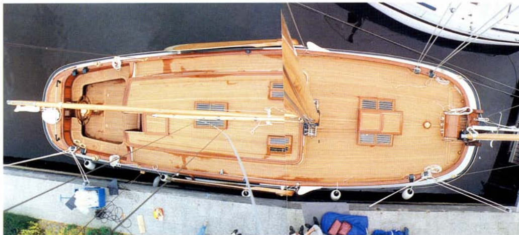
De 'Witte Walvis' met al het fraaie teakhout dat door Dörr Jachtbetimmering bv in Lemmer werd aangebracht.

thuishaven Nauerna nabij Westzaan, waar ik haar in de winter van 1984 ontdekte. In dezelfde winter, op 22 januari, ontstaat er kortsluiting en het schip brandt tot achter de mast uit, inclusief de rondhouten.