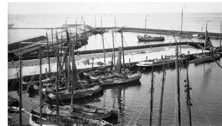
1925: De haven van Den Oever

De stichting Onderdak Nautisch Erfgoed Wieringen (ONEW) is een door de Belastingdienst goedgekeurde culturele ANBI organisatie. Zie hierboven bij 'Financiële ondersteuning'.