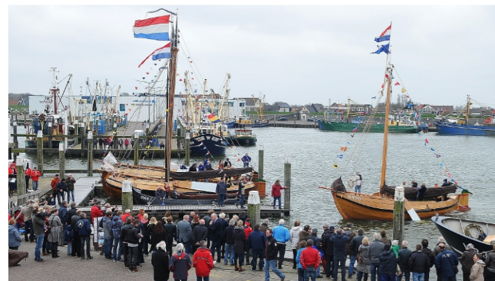
Na een restauratie van ruim 3 jaar werd het Skuutje op 25 april 2015 feestelijk onthaald in de haven van Den Oever.

Het Wieringer Skuutje WR60 ligt 's zomers in de Historische Hoek van de Vissershaven van Den Oever. Ook liggen hier meestal twee Wieringer aken, de WR4 'Zelden Pas' en de WR173 'Twee Gebroeders'.