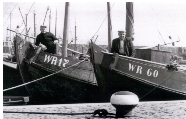
1966: Het Skootje tussen andere houten vissersschepen

Den Oever heeft daarmee de beschikking gekregen over een Historische Hoek waar behalve het bekijken van en varen met de voormalige vissersschepen ook informatie is te vinden over de visserij van vroeger en de ambachten die daar nauw mee verbonden waren (touw slaan, netten breien en boeten, zeilen maken, houtbewerking enz.).