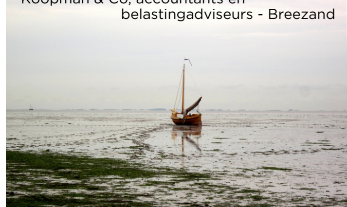
Droogvallen op het Wad bij Wieringen (voor Stroe)