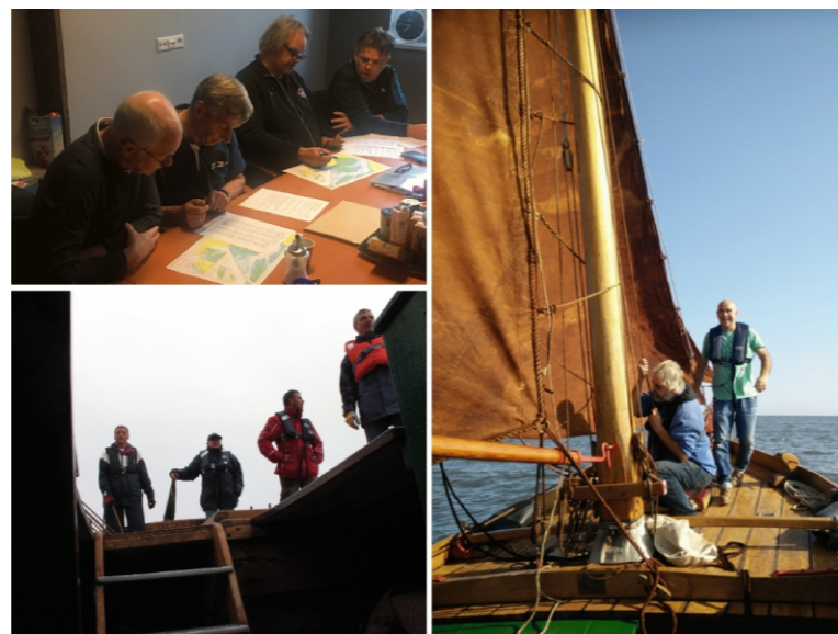
Cursisten van de cursussen 'Zeilen voor Landrotten' en 'Zeilen op getij'

Verder kunnen de werkzaamheden aan de Afsluitdijk mooi vanaf een van de schepen gade geslagen worden.