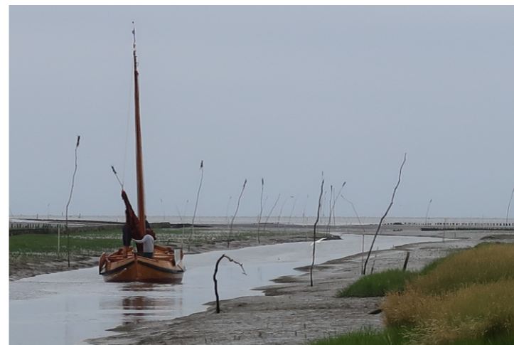
Het Skootje verlaat Noordpolderzijl (Noord-Groningen)

Neem contact met ons op indien je erover denkt Den Oever als uitvalsbasis te kiezen.