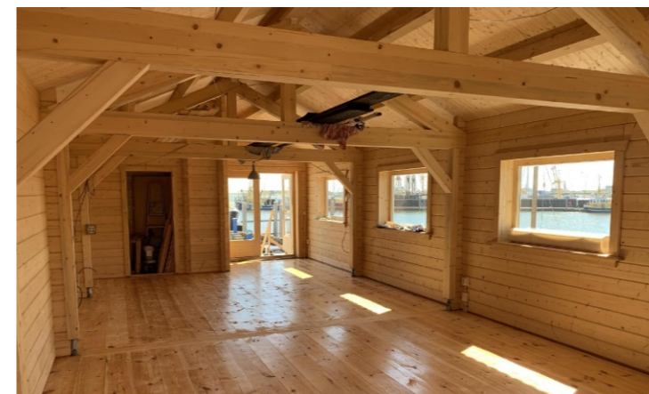
Binnen moet er nog veel werk verricht worden: er komen onder meer nog kasten voor de schepen, een keuken en een toilet.

Europees Landbouwfonds voor Plattelandsontwikkeling: Europa investeert in zijn platteland.