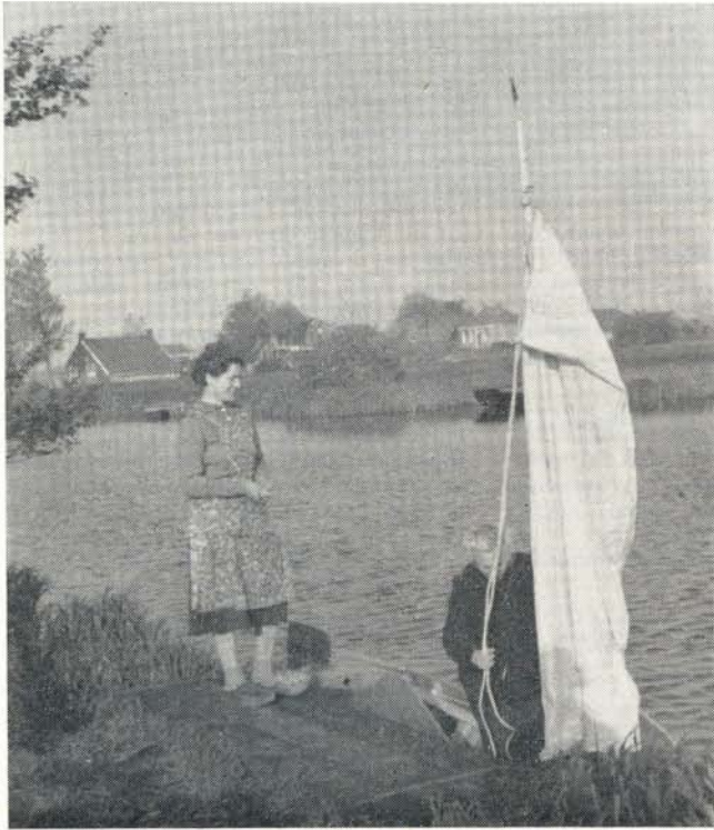
Afscheid van de gastvrije boerin aan de Tjonger.

wind was gedraaid naar het zuidwesten en minder fel. Vol goede moed vertrokken wij voor de „laatste loodjes”, zeilden met halve wind de Helomavaart af. Een bijzondere ervaring kregen we bij de bruggen. Omdat er geen hoorn aan boord was, konden we er niet op rekenen door de bruggewachter gesignaleerd te worden. De mast van het bootje is binnen de minuut te strijken, zodat we vlak vóór de brug van de zeilboot een roeiboot maakten. Het gevolg was, dat auto's halt moesten houden voor een simpel roeibootje omdat de bruggewachter deze snelle gedaanteverandering niet had opgemerkt. In de Driewegsluis werden wij gelijk geschut met een vrachtschipper, die constateerde, dat we op de Linde tegenwind zouden hebben en die daarom voorstelde ons te slepen.